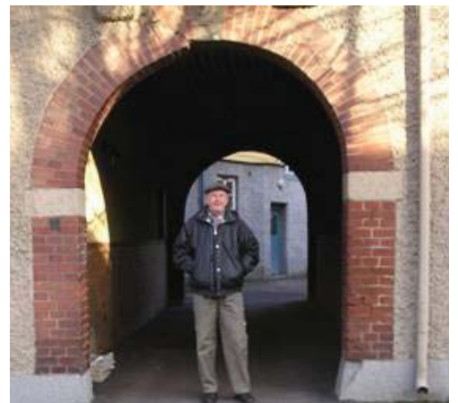
I porten till Ejdergatan 2