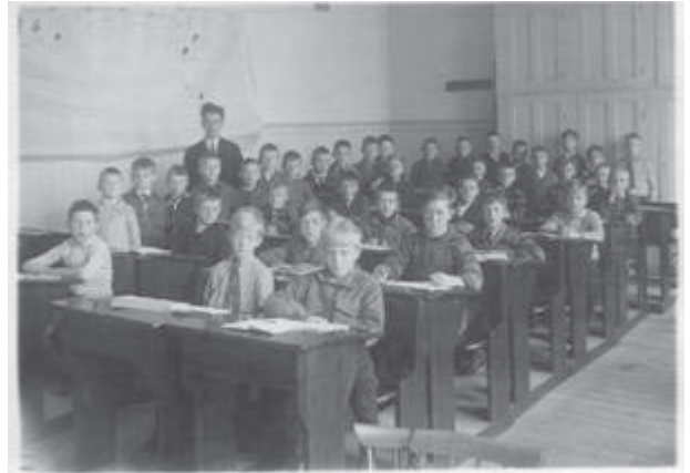
Ånässkolan klass 4 1932

Skoltiden klasserna 1 – 6 i Ånässkolan, lämnar inga ljusa minnen. Småskolan klasserna 1 och 2 är väl inte mycket att klaga på, men 3 – 6 med Sture Nilsson, som lärare lämnar en myckenhet av bitterhet och ångest. Han var en tuff kille av den "gamla skolan". Han slogs med pekpinnen så flisorna yrde, om någon hade förargat honom. Läxfria helger – det kunde vi glömma. Det kan väl sammanfattas med ett yttrande som en av mina klasskompissar kom med: "F-n, nu kommer snart det där dj-la jullovet igen"! Vadan denna ilska? Jo vi skulle t.ex. räkna minst 2 – 300 tal och skriva av texter från 30 – 50 sidor i utvalda böcker! Så nog vill jag helst glömma mina folkskoleår! Tyvärr fick mina skolår ett snabbt slut. Min far blev arbetslös när SKF permitterade flera hundra man under 30-talsdepressionen. Jag måste börja jobba. En släkting hade rekommenderat mig som bank- och tullombud på en färgfabrik på Marieholmsgatan. Av lönen på 75 kr i mån., fick jag behålla 5 kr – resten fick morsan till "matpengar"